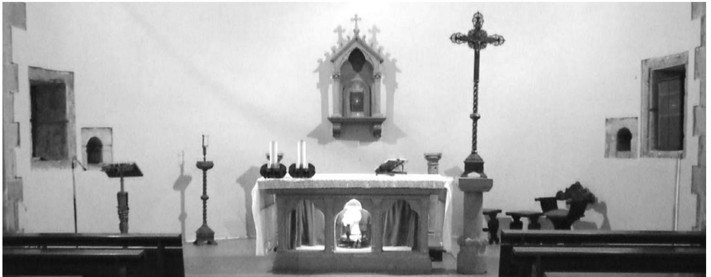
Chiesa di S. Francesco alla Rocca di Viterbo - La reliquia di S. Elisabetta.

Man mano si prendeva posto all'interno della bella Chiesa di stile romanico-gotico, scarna all'interno ma maestosa e solenne nella sua veste storica.