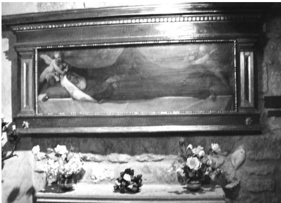
L'urna di S. Rosa da Viterbo, patrona della Gifra.

Cosa inaspettata e commovente è stata la celebrazione del rito di ammissione e di professione da parte di tre sorelle appartenenti alle Fraternità di Balsorano e di Orsogna, che con questo evento hanno suggellato la vitalità delle rispettive Fraternità di appartenenza nonché quella dell'OFS minori d'Abruz-