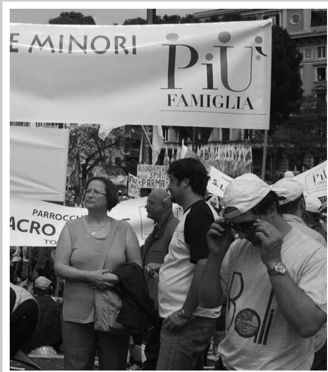
La Ministra Regionale al Family Day con la Fraternità Nazionale.

Il mio incontro con le famiglie, provenienti da ogni dove per partecipare al Family Day, è iniziato molto prima di giungere sulla Piazza di S. Giovanni in Laterano; è iniziato sul grande raccordo anulare, dove una lunga fila di autobus procedeva a lenta andatura, come un treno che si snodava a fianco della mia macchina.