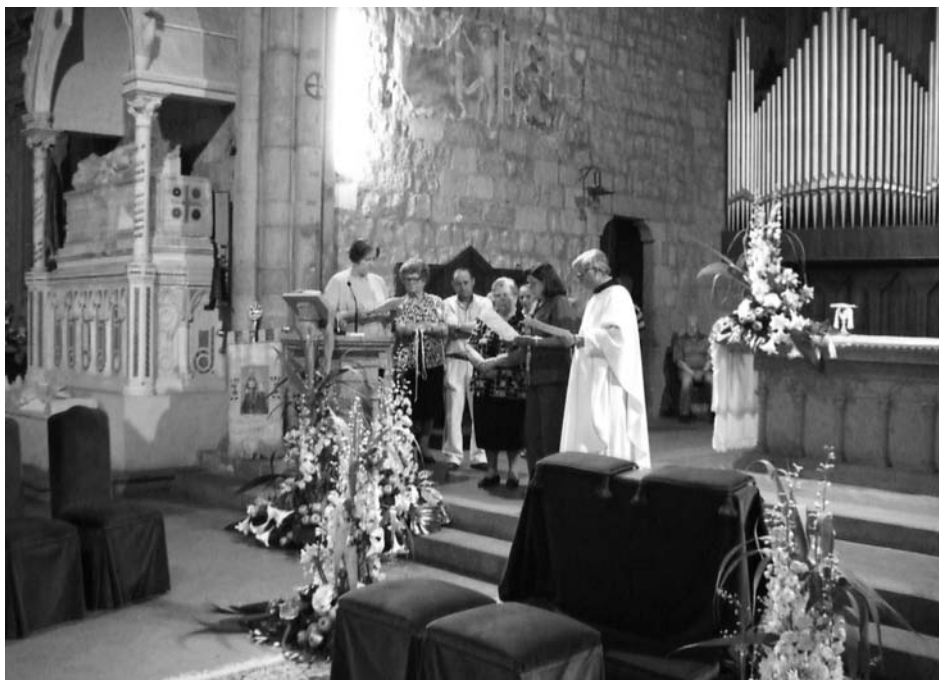
Il momento solenne dell'Ammissione e della Professione.

Per dissetarci sorella acqua era a nostra disposizione da un rubinetto del giardino. Confessiamo di aver anche gustato delle squisite susine che ci ammiccavano dai rami dei vari alberelli sparsi qua e là.