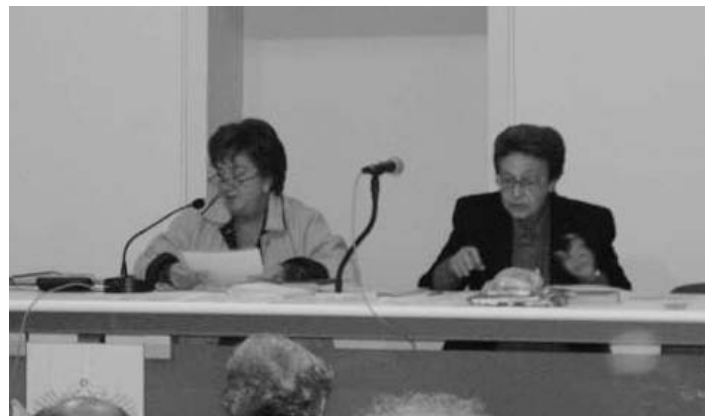
Popoli - La ministra regionale Franca Barcone e la viceministra regionale Lucia D'Acchioli.