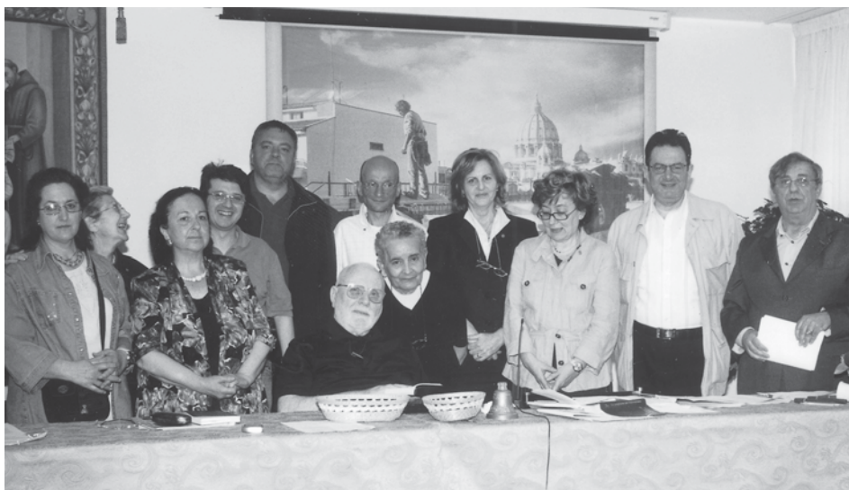
Il neo eletto Consiglio Regionale Ofs Minori con i responsabili nazionali.

Aggiungo che, tutte le fraternità, inoltre, si sono adoperate per affermare i temi della "Scuola di Pace"