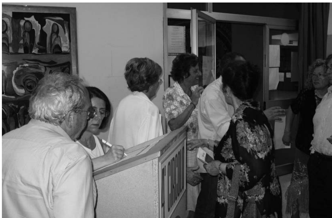
Latina - Le persone firmano per la proposta di legge d'iniziativa popolare.