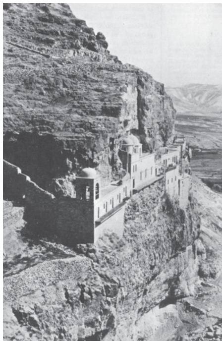
Monastero greco-ortodosso posto sulle pareti di Gebal Qarantal dove la tradizione ha localizzato il digiuno e la tentazione del Salvatore.

A tal proposito, come non ricordare la celebre testimonianza di Sant'Agostino... "Tardi ti ho amato, Bellezza tanto antica e tanto nuova, tardi ti ho amato!... Tu eri con me, ma io non ero con te... Ma il tuo grido ha vinto la mia sordità; la tua luce ha vinto la mia cecità... mi hai toccato, e ora ardo dal desiderio della tua pace!".