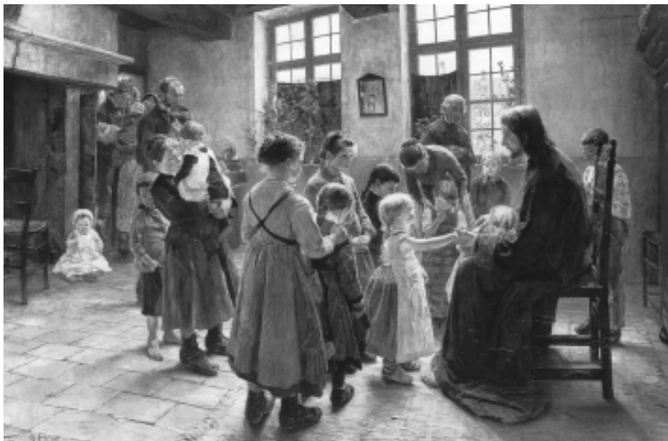
Gesù accoglie i bambini.