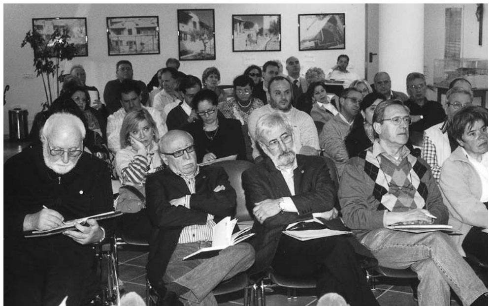
Roma - Scuola di Pace Nazionale (25-27 aprile 2008).

Fare sistema. La risposta dei potenti a chi esprime esigenze di cambiamento di solito è la seguente: comincia a cambiare tu; sanno benissimo che in tal modo nulla cambierà (per loro). Se anche tutti noi mettessimo pannelli solari sul tetto, il risparmio energetico sarebbe un'inezia rispetto a quanto consuma un aereo militare o alle cifre enormi (quasi 1500 miliardi di $ all'anno) che si spendono nel mondo per fare o preparare guerre. Maggiori possibilità di incidere si avrebbero se, anziché iniziative di persone isolate, ci si muovesse in gruppo ed a livello colletti-