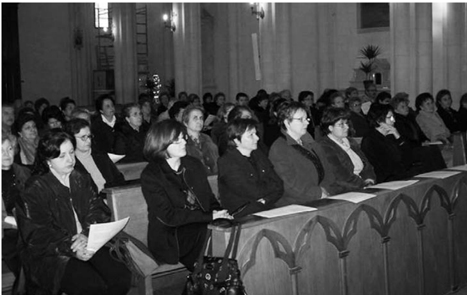
Manduria - Celebrazione del Centenario di S. Elisabetta.

• 25 Novembre 2007 - Manduria - L'esercizio della speranza "La famiglia luogo di accoglienza, condivisione e dialogo".