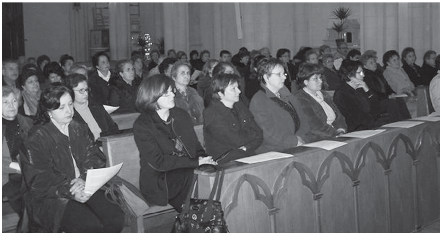
Manduria - L'assemblea in attento ascolto.