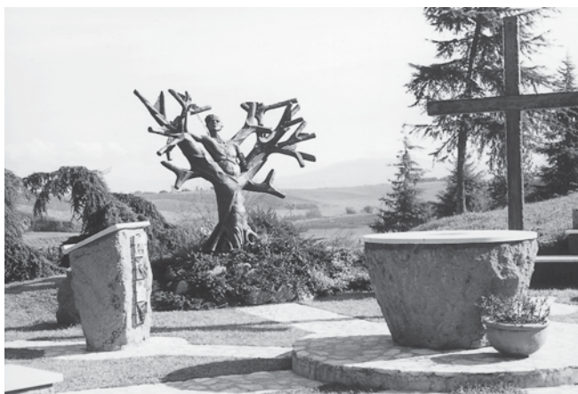
Presso la Madonna del Divino Amore a Roma, una cappella a cielo aperto per ricordare i 500.000 zingari vittime del genocidio nazista.

e di conoscenza, essendo essi un popolo quasi "costituzionalmente nomade". Ai fini di una tale accoglienza è inutile richiamare qui, a noi francescani, la nostra Regola, che ci vuole "pellegrini e forestieri in questo mondo" cioè a dire proclivi ad una forma di "nomadismo spirituale" che, se certo non può acquisire le modalità di vita degli zingari, presuppone apertura a relazionarci con tutti senza esclusioni o riserve mentali, nella convinzione che è il Signore stesso a condurci là dove