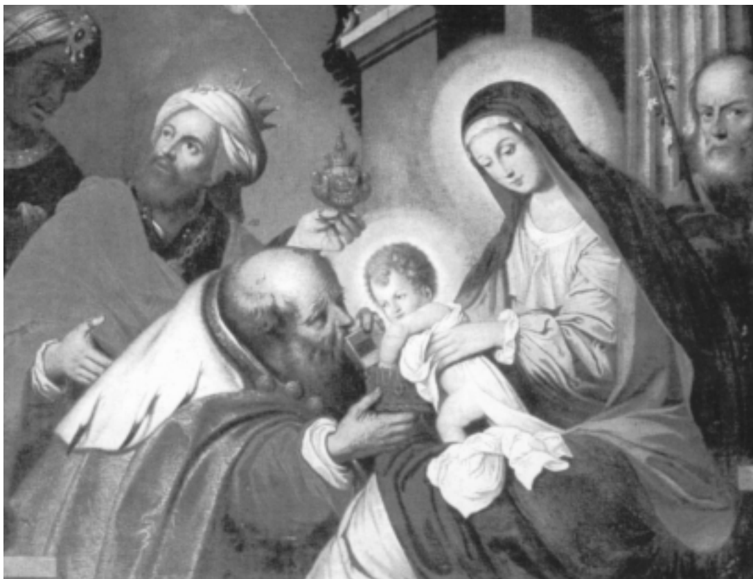
Come i re Magi e come il nostro Padre S. Francesco ognuno di noi si senta attratto verso il Bambino Gesù, manifestazione dell'amore e della misericordia di Dio che viene a salvarci e a riempire di senso, di gioia e di pace la nostra vita. Buon Natale!