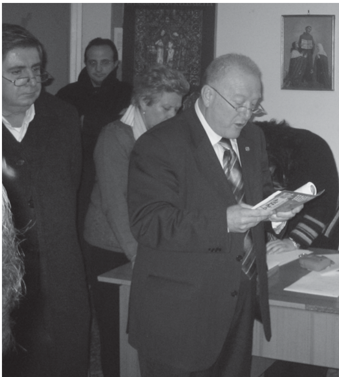
Capitolo Regionale: la preghiera sugli eletti.