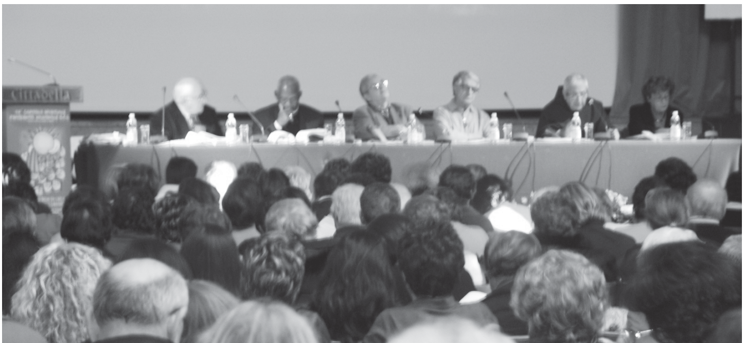
Assisi - Il Convegno che ha aperto il Capitolo Spirituale Nazionale 2008.