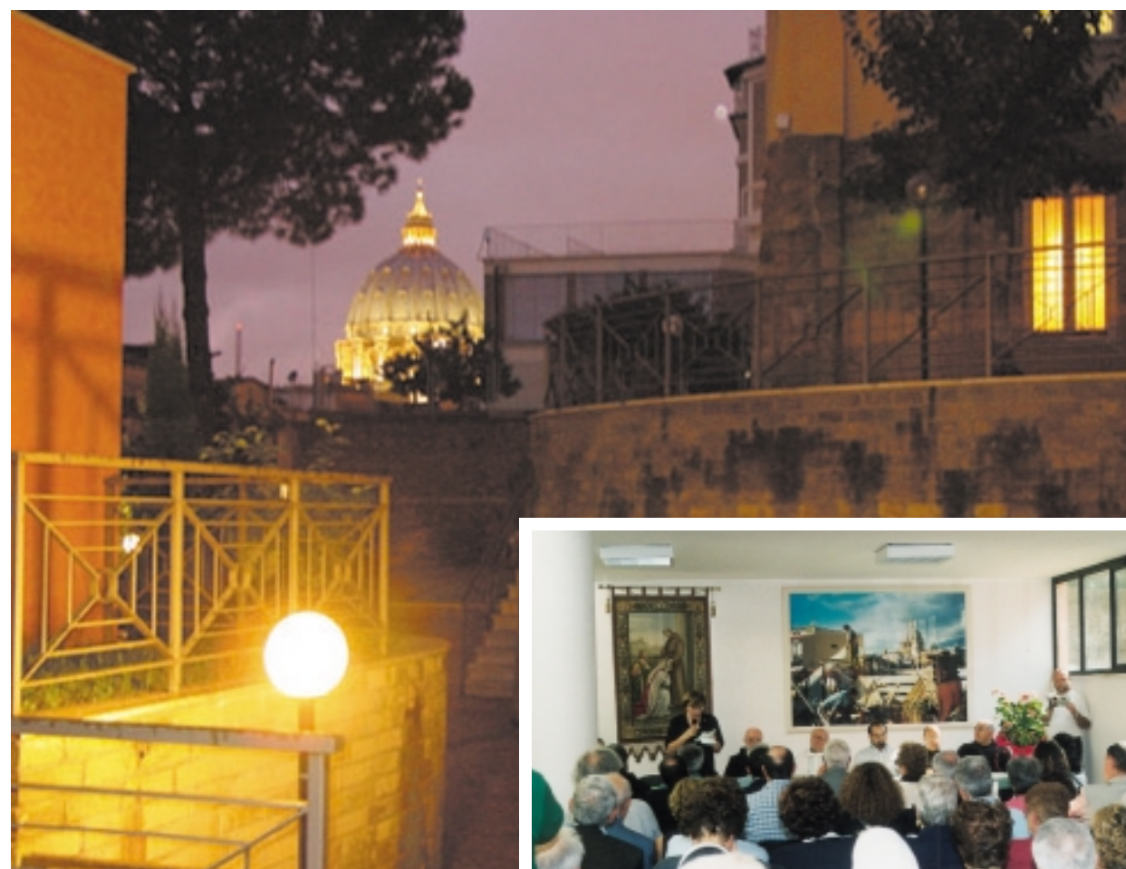
La finestra della Cappella dove ogni giorno si celebra l’Eucarestia e si prega per la Chiesa e per il mondo. A fianco la Sala Convegni per crescere nella vocazione francescana e secolare.