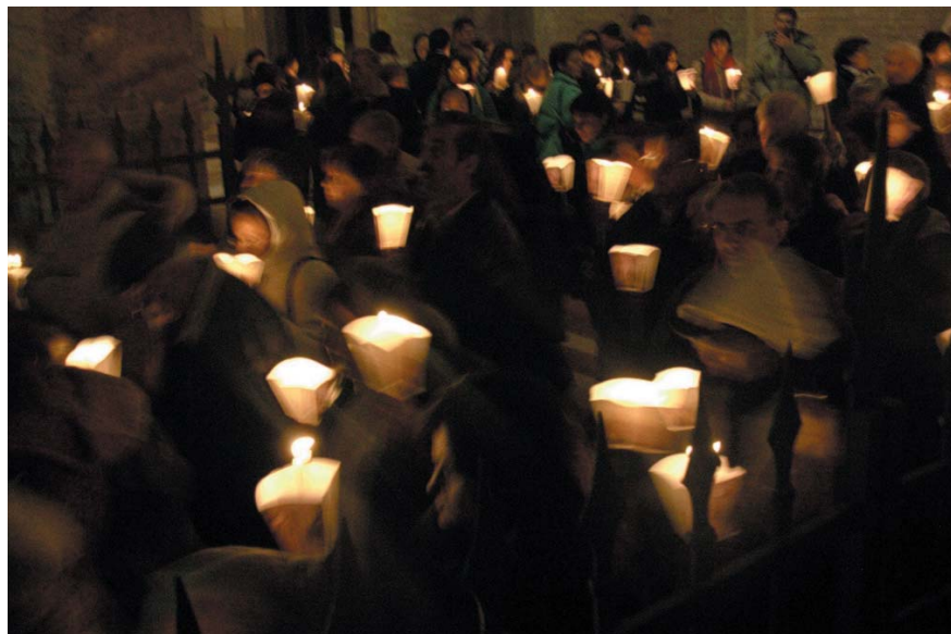
La Veglia per la pace.