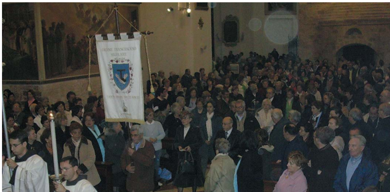
Processione d’ingresso in Santa Maria degli Angeli.