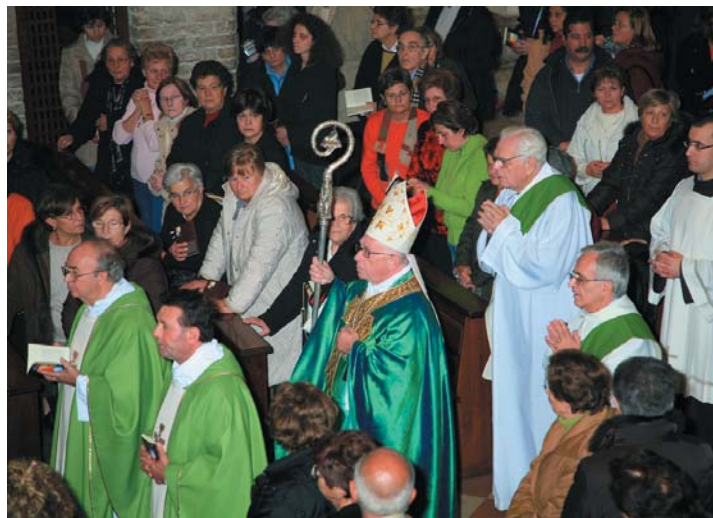
Il Vescovo Domenico Tarcisio Cortese che ha presieduto la celebrazione Eucaristica.

Nella suggestiva conclusione del Capitolo presso la Basilica di S. Chiara la penetrante parola delle beatitudini evangeliche nella esemplarità di Francesco e Chiara ha preso rilievo attraverso l'intensa meditazione guidata da P. Vittorio Viola, Superiore della Fraternità Ofm di S. Chiara. Il Messaggio finale "In dialogo per sperare la pace" , dato ad ogni partecipante, è ora nelle nostre mani perché diventi impegno di tutti. Sentiamo nel cuore la riconoscenza più profonda che tutto questo ci sia stato consegnato dal luogo in cui viene conservata l'immagine del Crocifisso che 800 anni fa parlò a Francesco. E' fissando quegli occhi che Francesco e Chiara hanno potuto comprendere come essere uomini e donne della beatitudine e della pace. Lasciando Assisi, in questo anno in cui il Vescovo della città di Francesco, S.E. Mons. Domenico Sorrentino, ha proclamato anno della conversione, abbiamo chiesto al Signore che quello sguardo non ci abbandoni mai e ci aiuti a ricominciare ... ci aiuti a riparare. □