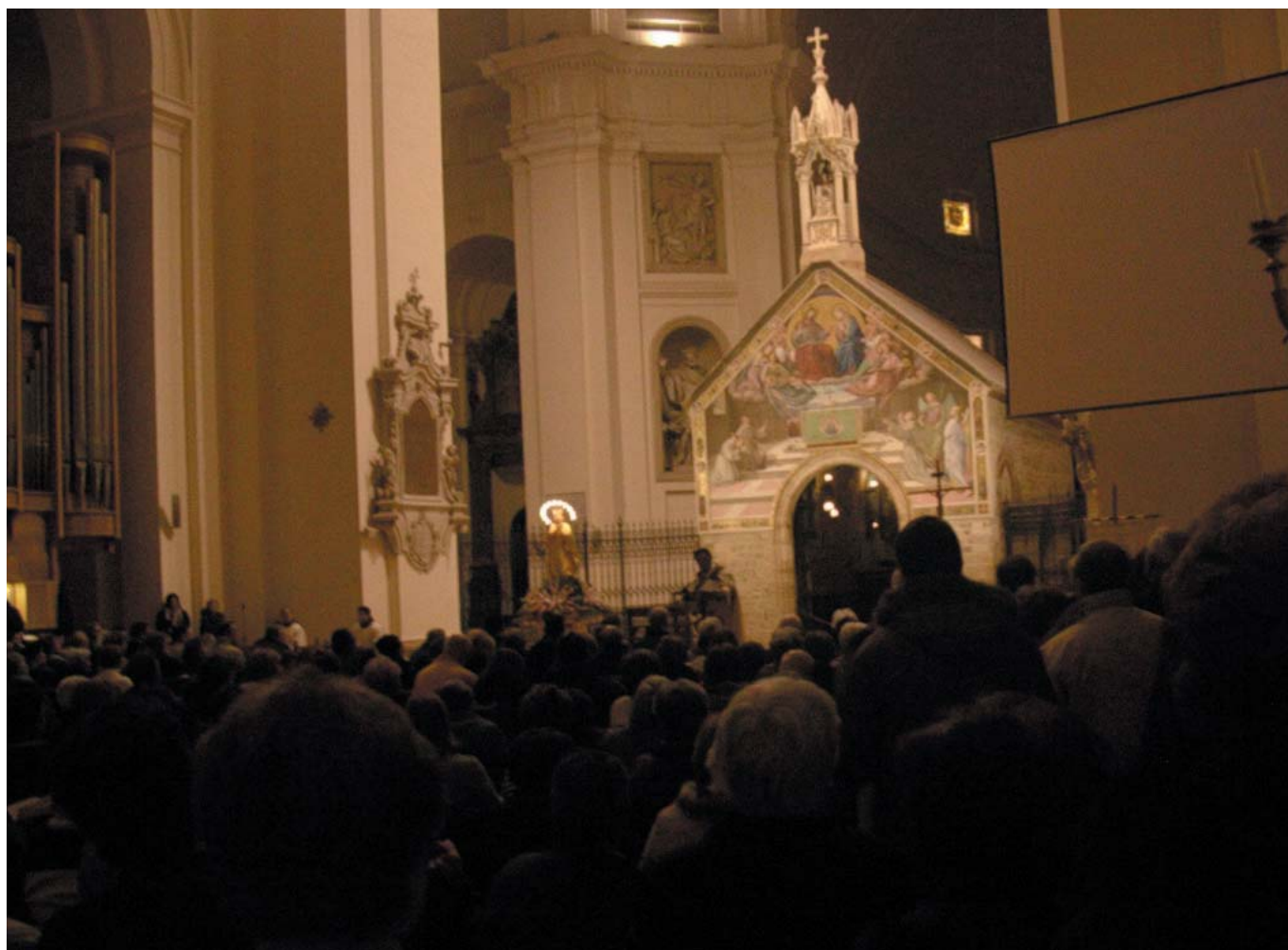
I fedeli rientrano in Porziuncola dopo la processione sulla piazza di S. Maria degli Angeli.