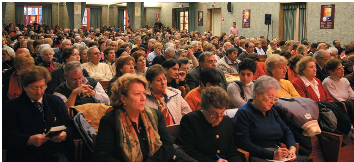
I partecipanti al Convegno provenienti da ogni parte d’Italia.

Lo faranno esemplarmente da questo Convegno che apre il Capitolo, intrecciando le ragioni della nostra fede e della nostra vocazione con la situazione del mondo, con le condizioni brucianti di chi vive tutta la difficoltà della coesistenza e ponendo i nessi tra il dato religioso e il procedere della civiltà, allo scopo di aprire il nostro cuore e la nostra mente a quelle strategie di pace che, fondate in Cristo nostra pace, sono