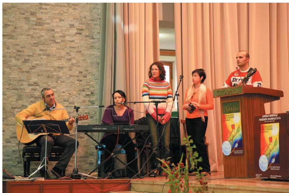
Il gruppo canoro della Fraternità di Puglia Molise che ha animato i canti nel Capitolo.